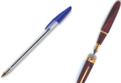
Stylo à encre, stylo à bille