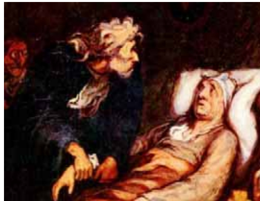
(Le Malade imaginaire, peinture d'Honoré Daumier)

TOINETTE (la servante d'Argan) ARGAN (le malade) PURGON (le médecin d'Argan) MOLIERE (l'auteur) ANGELIQUE (la fille d'Argan) FLEURANT (l'apothicaire) BELINE (l'épouse d'Argan) CLEANTE (le fiancé d'Angélique) MONSIEUR DE BONNEFOY (notaire)